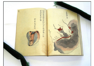
寄贈書より。全身麻酔による乳がん摘出に世界で初めて成功した華岡青洲(1760～1835)の業績を弟子が筆写した写本(1805年頃)。