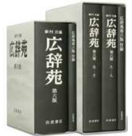
平木氏が編集に携わった 岩波書店『広辞苑』

目の前のことを一生懸命、真面目にやるしかないのだと、この年齢になってあらためて思う所以である。