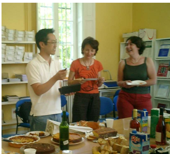
職場で料理を「楽しむ」

大学卒業の際は、親戚に何人かいたこともあり産婦人科も考えましたが、どうしても子宮や卵巣に興味を持てませんでした。精神科に進むことは「家が精神科か、本人が患者か」などと言われましたが、「脳はどのように機能するのか」について興味があり、結局精神医学の道に進み認知症について研究を始めました。しかし、当時認知症は病気という認識に乏しく教授や上司に「年を取ったら誰でもなる」などと言われる始末でした。このような過酷な？状況下でも、脳波のデジタル解析といったこれまたマイナーな研究を行いつつ、認知症の疫学調査といった地道な研究に関わったことは私にとってはとても楽しかった経験です。現在も細々と脳波研究は継続していますが、現在の脳研究はPETやMEGといった画像研究が全盛であり、脳波研究は注目されない分野です。さらに残念ながら満足できる成果も出せていない現状です・・・でも私自身は楽しんでます。